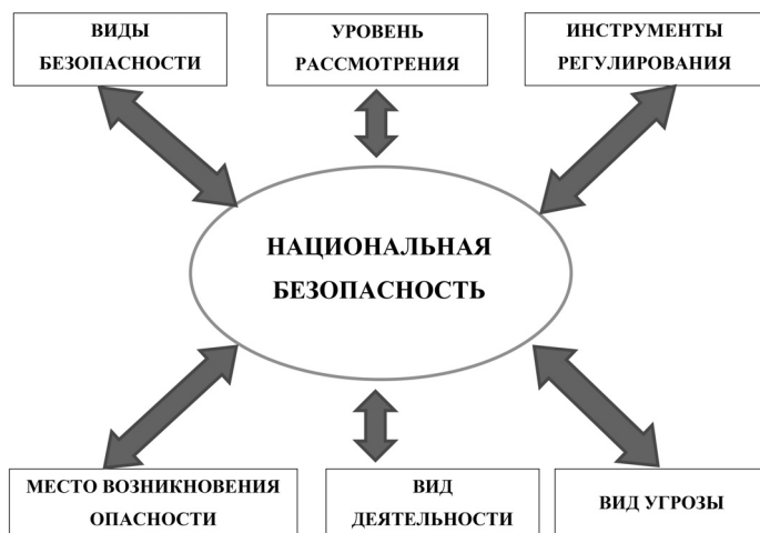
Рис. 2. Базовые критерии структурирования системы национальной безопасности

На рис. 2 представлен перечень возможных критериев, оказывающих наибольшее влияние на уровень национальной безопасности.